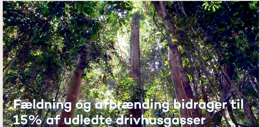
Den tropiske regnskov. Se klippet på kortlink.dk/y8m6

Regnskove er samtidig med til at bremse global opvarmning og klimaforandringer. Regnskoven har et unikt økosystem til at optage CO 2 fra atmosfæren og gemme store mængder